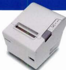
伝票用サーマルプリンタ