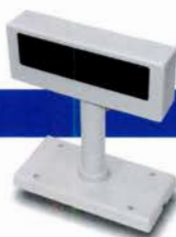
カスタマディスプレイ