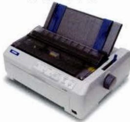
見出しシール用プリンタ