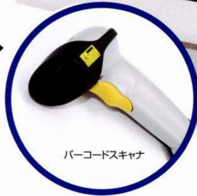
バーコードスキャナ