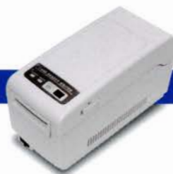
リライトカードリーダー